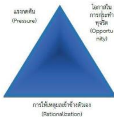
ภาพ การพัฒนาของทฤษฎีสามเหลี่ยมการทุจริต